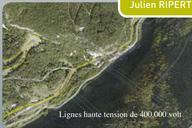
Lignes haute tension de 400.000 volt