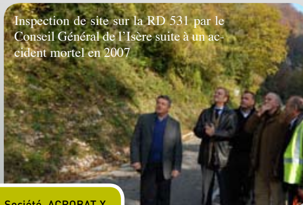
Inspection de site sur la RD 531 par le Conseil Général de l'Isère suite à un accident mortel en 2007