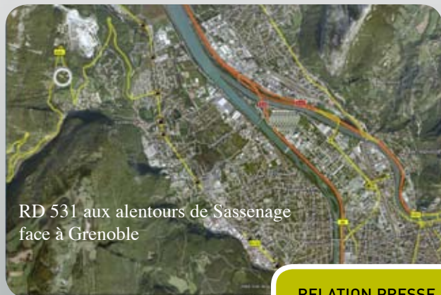
RD 531 aux alentours de Sassenage face à Grenoble